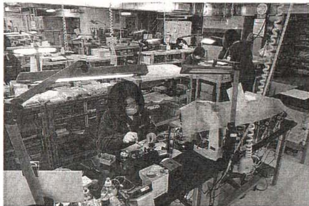
【写真左】若手がネットを活用したマーケティングなどで活躍する